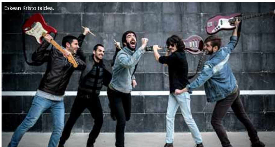
Eskean Kristo taldea.

Urterik urte jendetza handia batzen da Larrabetzuko Gazte Egunean. Hangoekin Txorierriko gazteek ez ezik beste herrietakoek ere egiten dute bat eta aurten ere hala izatea espero dute. "Ez daki-gu esaten zenbat jende batuko den, baina jendea etorriko dela... segurur! (kar, kar).