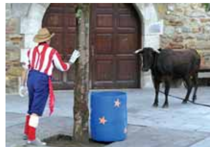
22 Larrabetzu eta Lezamako jaiak