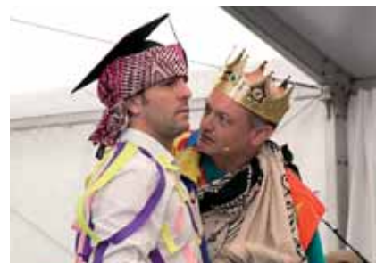
32 Lagatzu Eguna-Euskal jaia