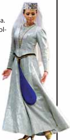
Ak Maral Kirguistaneko ballet nazionala.