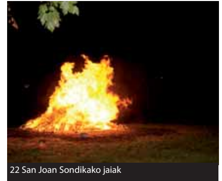
22 San Joan Sondikako jaiak