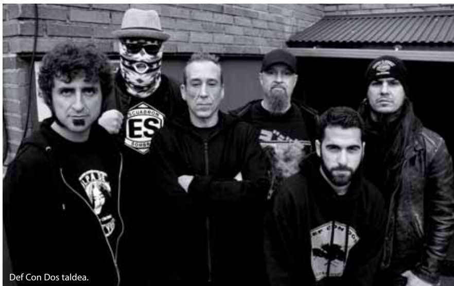
Def Con Dos taldea.

Pazko jaiak ekainaren 2tik 5era ospatuko dabez Zamudion. Aurreko urteetan moduan, Eguraldi Ona jai-batzordeak jai herrikoiak antolatu dauz eta adin-tarte guztietako zamudioztarrek eukiko dabe zer egin eta zertaz disfrutau. Halan, betiko ekitaldiak mantendu dabez, baina nobedadeak be egongo dira.