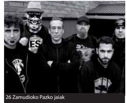
26 Zamudioko Pazko jaiak