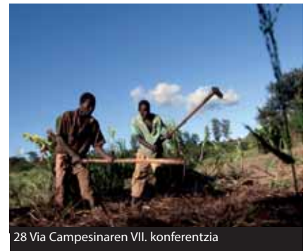
28 Via Campesinaren VII. konferentzia