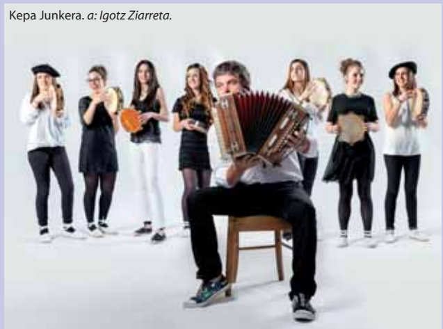
Kepa Junkera.