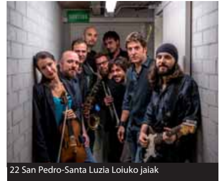
22 San Pedro-Santa Luzia Loiuko jaiak