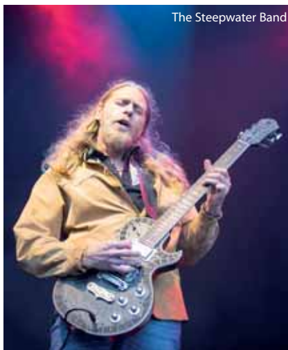
The Steepwater Band

Mud Candies bilbotarren bluegrassak bigarren eguna hasi zuen; eta, ordubete-