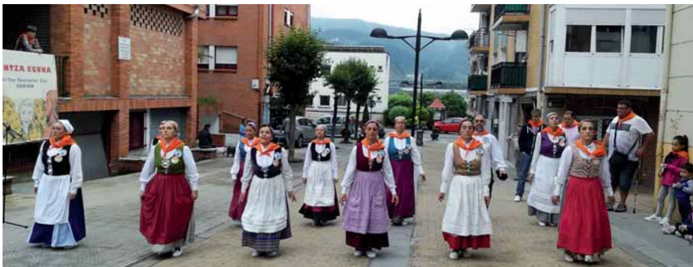
a: Topagunea, Berbalagunek, Gurasolagunek

Mintzalagun, solaslagun, mintzakide zein berbalagun izenpean, ekainaren 3an Euskal Herri osotik etorritako lagunak batu ziren Derion, euren jai handia, Mintza Eguna, ospatzeko. Egitarau oparoa antolatu zen egun osorako, hala nola bisita gidatua Bilboko hilerrietik, bertso-triki-dantza-poteoa, herri bazkaria eta kantaldia.