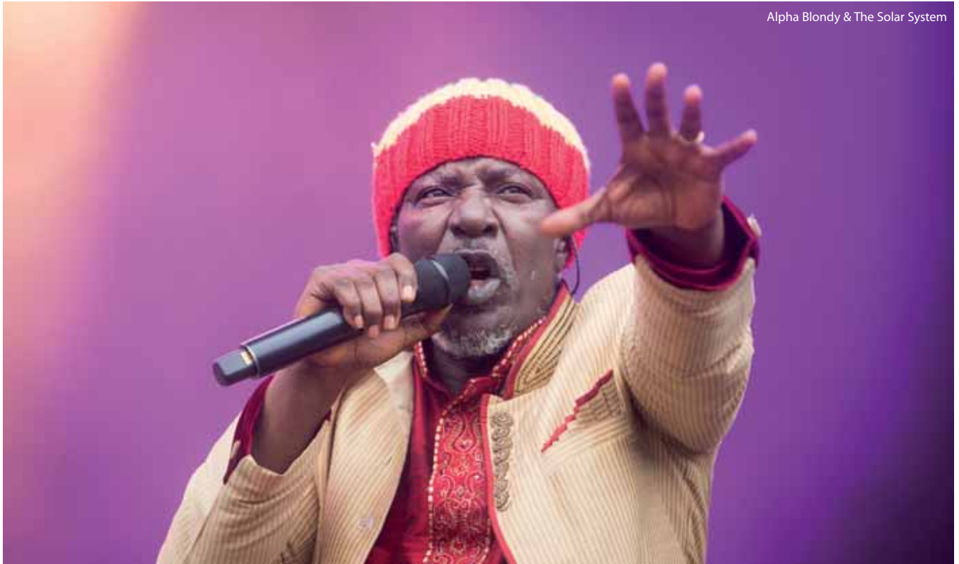
Alpha Blondy & The Solar System

ra, gorriz jantzitako Wyomingen taldeak erreleboa hartu eta bertsio famatuz beteriko zuzeneko eskaini zuen. Euria gogor hasi zen baina, hala ere, jendetza batu zuen madrildarren kontzertuak. Jaialdiak berak kapusaiak eta kapak erosteko aukera eskaini zuen –barrutian aterkiak sartzea debekatuta zegoen–, eta benetan beharrezkoak izan ziren: kontzertuen artean eta mela-mela eginda, jendea txosnen karpan aterpea bilatzen ibili zen. Euriak The Steepwater Band rock-blues taldearen kontzertua ordu erdi atzeratu zuen baina, azkenean, eta instrumentuak plastikozko olanekin estalita, Chicagoko taldeak merezitako kontzertua eskaini zion publikoari. Ondoren Imelda Mayren soul dotorea, Alpha Blondyren reggae aldarrikatzailea eta Gov't Muleren gitarroen lekukoak izan ziren bertara hurbildu ziren pertsonak.