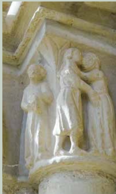
3- Tuestako kapitela