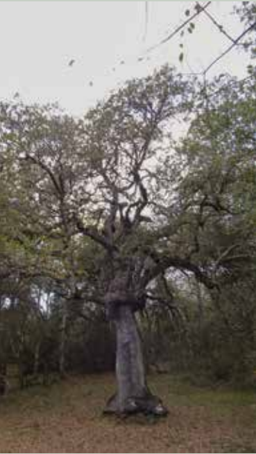
6- Zin artea