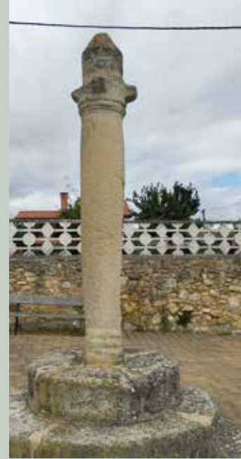
9- Villanañeko pikota

erotismoz beteta dagoena topatzea. Zein asmorekin zizelkatu ote zuten? Ondoko etxe batean giltzak lortuz gero, barrura sartu gaitzke, bisitak merezi du eta.