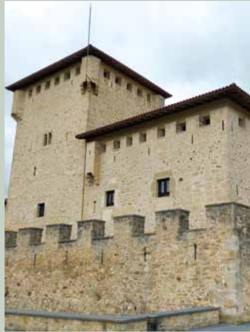
8- Baronatarren dorretxea