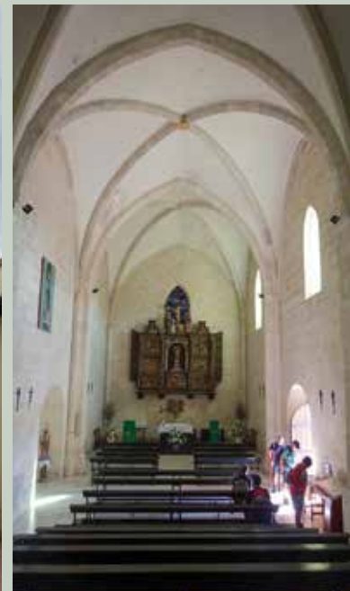
5- Angostoko santutegia