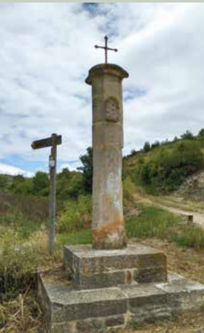
2- Añanako pikota