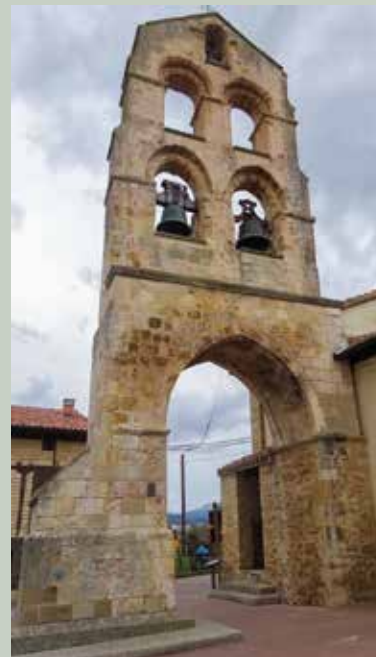
4- Villamaderneko kanpadorrea