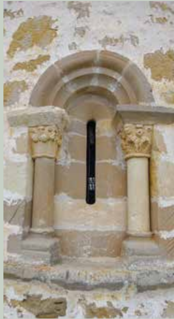
7- Bellojineko lehiu erromanikoa