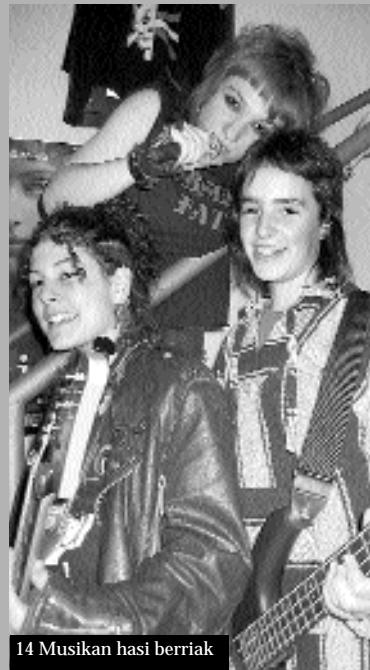
14 Musikan hasi berriak