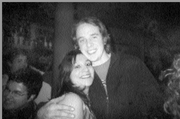
Anglie eta Euskal Herriko familia