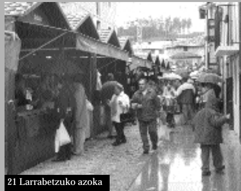
21 Larrabetzuko azoka