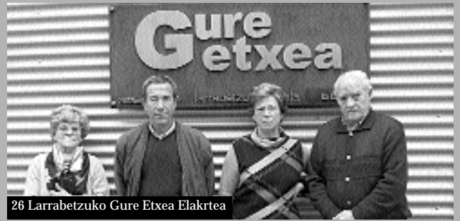
26 Larrabetzuko Gure Etxea Elakrtea