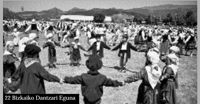
22 Bizkaiko Dantzari Eguna