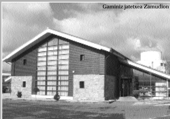
Gaminiz jatetxea Zamudion

Erregosi abakandoaren zatiak eta txibia-tailarinak, bota fideoetara eta gehitu koilaradaka bat berakatz-pomada. Belar freskoak txikitu eta hautseztatu.